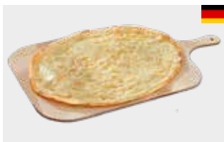
Flammkuchen mit Crème