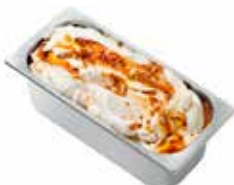
Mantecati Panna Cotta