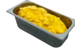
Mantecati Frutto della passione laktosefrei