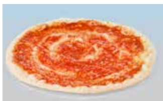
Pizza-Boden 27 cm