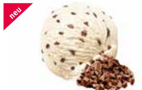
Stracciatella mit Schokoladensplittern