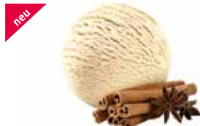
Zimt mit Caramelzucker