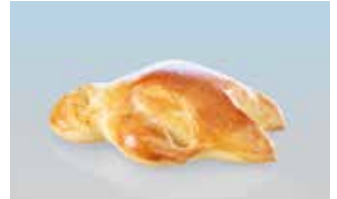
Grittibänz 50 g