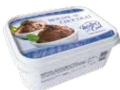
Mousse au Chocolat

Art.-Nr. MC7126 Inhalt 18 x 115 g pro Stück/Karton 2.52/45.36