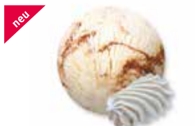
Doppelrahmglace mit Meringuestückchen