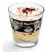
Latte Macchiato Mini

Art.-Nr. MC4334 Inhalt 6 x 260 ml pro Stück/Karton 4.14/24.84