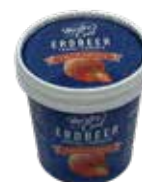
Pistache mit Erdbeersauce

Art.-Nr. MC4702 Inhalt 18 x 135 ml pro Stück/Karton 2.06/37.08