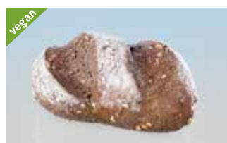
Schlossbrötli 70 g