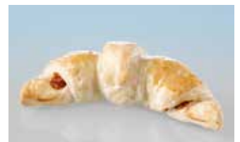
Nussgipfel 80 g