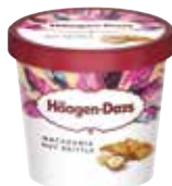
Häagen-Dazs Macadamia Nut

Art.-Nr. MC5962 Inhalt 24 x 95 ml pro Stück/Karton 3.21/77.04