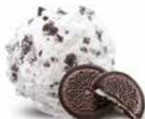
Cookies & Cream

Art.-Nr. 11014444 Inhalt 2000ml pro Bidon 20.90