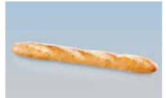
Baguette française 48 cm