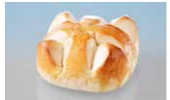
1. August-Weggen gross