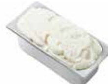
Mantecati Noce di Cocco