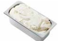
Mantecati Fior di Latte