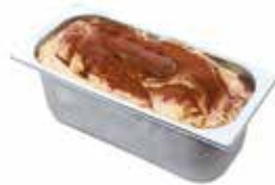
Mantecati Tiramisù Venezia