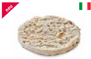
Pinsa La Tonda 32 cm