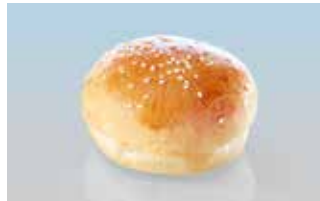
Hamburgerbrötli «kids» 7 cm