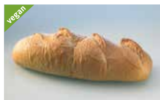
Ruchrotz 1 kg geschnitten