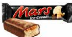
Mars Ice Cream

Art.-Nr. MC5756.1 Inhalt 24 x 60 g pro Stück/Karton 1.80/43.20