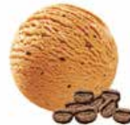
Eiskaffee mit Mokkastückchen