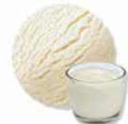
Fior di Latte