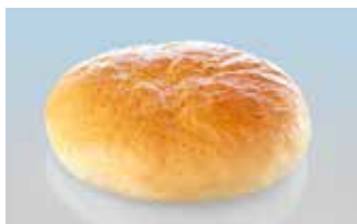
Big-Hamburgerbrötli 17 cm