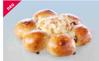
Königskuchen mit Schoggistückli