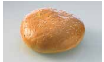
Hamburger-Brötli mit Sesam