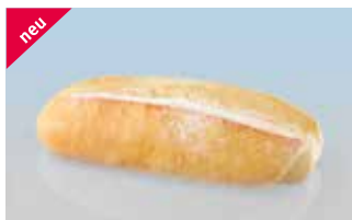
Ciabatta-Sandwich 18 cm