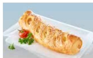
Geflügelwürstli im Teig mit Frischkäse