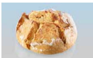
Urdinkelrotz mit Sauerteig