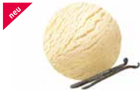
Vanille mit Vanillesamen