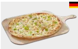
Flammkuchen Griechischer Art