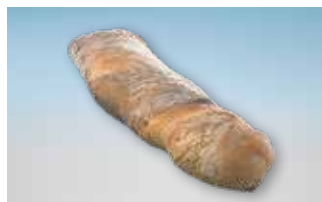
Pain Paillasse rouch