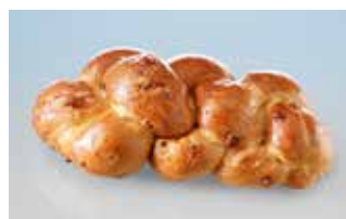
Speck Zopf 500g