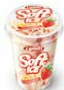
Soft Ice Vanille & Erdbeere