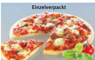
Pizza Margherita 28 cm Einzelverpackt