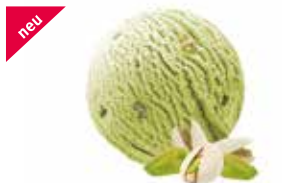
Pistache mit Pistazienkernen