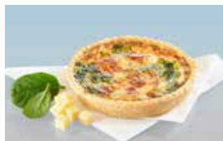
Spinat-Chüechli 14 cm