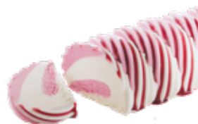
Panna Cotta Cake