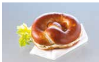
Laugenbrezel gefüllt mit Butter*