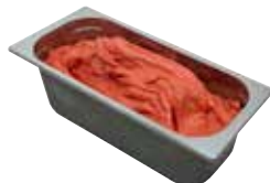
Mantecati Fragola laktosefrei