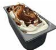
Mantecati Panna-Variegato con Nusella