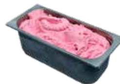
Mantecati Frutto della Lampone