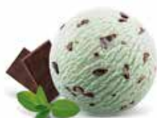
Menthe & Chocolat

Art.-Nr. 1001674 Inhalt 2000ml pro Bidon 20.90