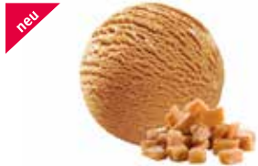
Caramel mit Rahmtäfelchen