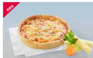
Gemüsechüechli 14 cm