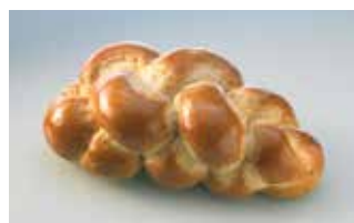
Gurtner Spez. Zopf 300g