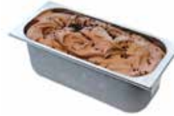
Mantecati Quore di Cacao