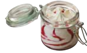
Confettura frutti di Bosco

Art.-Nr. MC4396 Inhalt 6 x 110 ml pro Stück/Karton 3.20/19.20