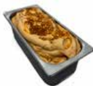
Mantecati Dulche de Leche