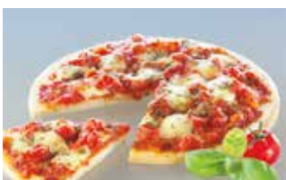
Pizza Margherita 28 cm