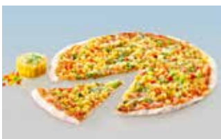
Flammkuchen Mexican 28 cm