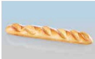
Baguette ca. 40 cm