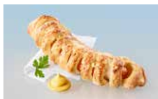
Wienerli im Teig