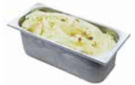
Mantecati Pistacchio Sicilia