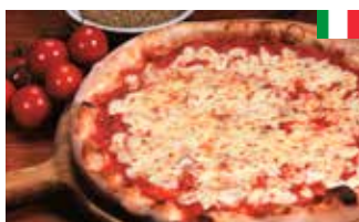
Pizza Margherita 30 cm