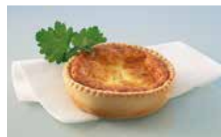
Käsehüechli 9 cm