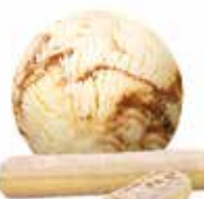
Tiramisu mit Biscuit