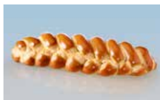
Gurtner Spez. Zopf 2 kg