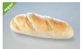
Halbweissrotz 1 kg