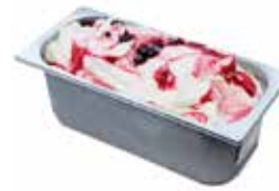
Mantecati Yogurt di Bosco