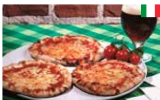
Snack-Pizza 15 cm