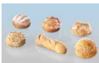
Brötli Mix, 6 Sorten