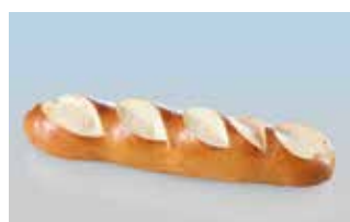
Laugen-Parisetli 21 cm