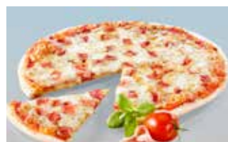
Pizza Prosciutto 28 cm