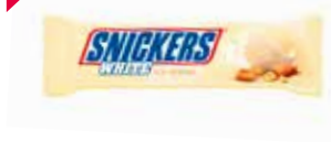
Snickers White Ice XTRA

Art.-Nr. MC5756.5 Inhalt 24 x 61 ml pro Stück/Karton 1.80/43.20