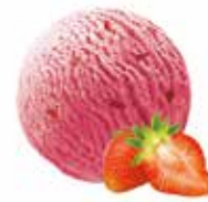
Erdbeere mit Erdbeerstückchen