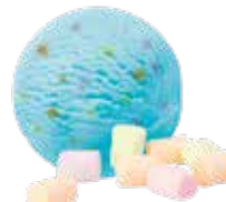
Puffo mit mini Marshmallows