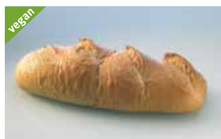
Ruchrotz 1 kg