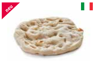
Pinsa Romana Mini 19 × 21 cm