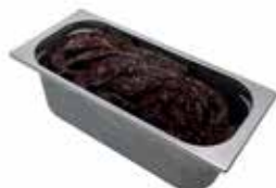
Mantecati Cioccolato Dark