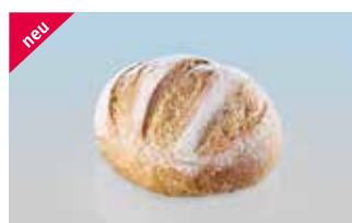
Maggia-Brötli 75 g