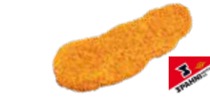
Pouletbrust Form Sandwich-Schnitzel CH 100 g

Art.-Nr. 1717.509 Inhalt 2 × 2,5 kg pro kg/Karton 18.50/92.50