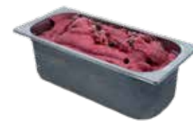
Mantecati Frutti di Bosco