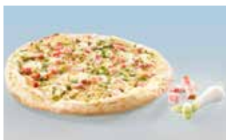
Flammkuchen Classic 28 cm