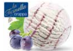
Grappa la Ticinella Glace

Art.-Nr. 1001053 Inhalt 2000ml pro Bidon 20.90