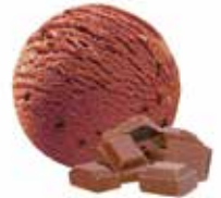
Schokolade mit Schokoladenstückchen