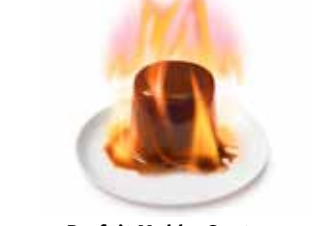
Parfait Mokka Gastro