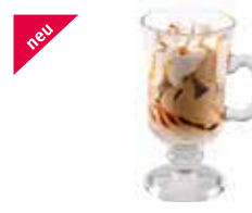
Boccale Irish Coffee

Art.-Nr. MC4400 Inhalt 6 x 150 ml pro Stück/Karton 4.00/24.00