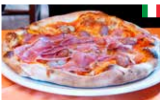
Pizza Prosciutto 28 cm