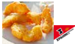
Eglifilet-Knusperli im Bierteig

Art.-Nr. 17140 Inhalt 1 × 5 kg pro kg/Karton 12.90/64.50