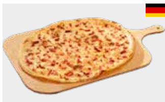
Flammkuchen Elsässer Art