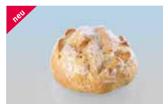
Bure-Brötli 75 g