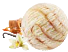
Vanille & Caramel salé

Art.-Nr. 1002964 Inhalt 2000ml pro Bidon 20.90