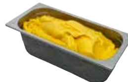
Mantecati Mango laktosefrei