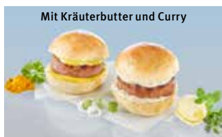
Mit Kräuterbutter und Curry