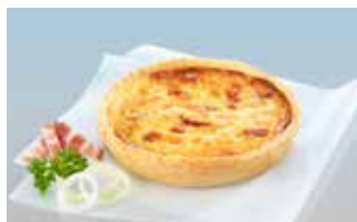
Quiche Lorraine 14 cm