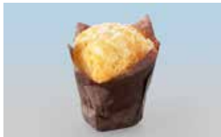
Weisser Schoggi Muffin