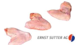
Poulet-Flügel CH 60-70 g

Art.-Nr. 14155 Inhalt 4 × 1 kg pro kg/Karton 14.40/57.60