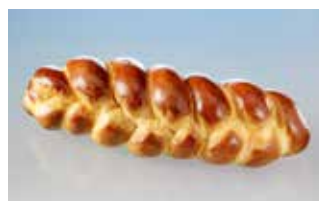
Spez. Zopf 1 kg geschnitten