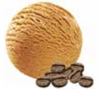
Eiskaffee ohne Stückchen