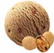
Baumnuß mit Nussstückchen