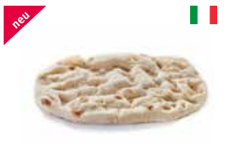
Pinsa Romana Classic 30 × 19 cm