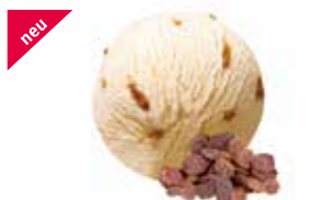
Jamaika mit Sultaninen