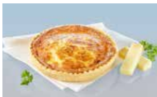
Käsehüechli 14 cm