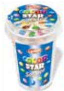
Soft Ice Color Star