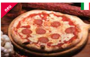
Pizza Chorizo 28 cm