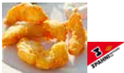
Pangasius-Knusperli im Bierteig

Art.-Nr. 99000 Inhalt 4 × 2,5 kg pro kg/Karton 7.90/79.00