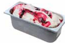
Mantecati Panna Amarena Fabri