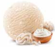
Crème De Gruyère

Art.-Nr. 1002964 Inhalt 2000ml pro Bidon 20.90