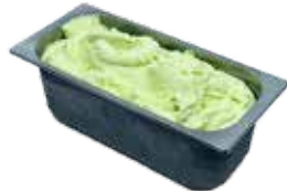
Mantecati Mele verde