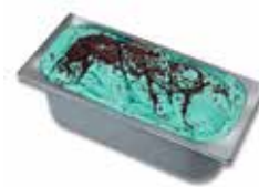
Mantecati Ciocomenta Fabbri