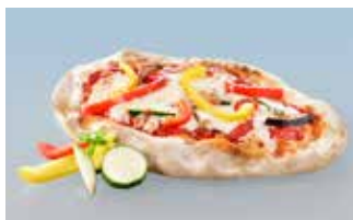
Pinsa ovale Verdure