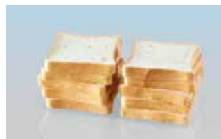
Toastbrot verpackt 250g