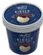
Kirsch, Joghurt mit Kirschsauce

Art.-Nr. MC4708 Inhalt 18 x 135 ml pro Stück/Karton 2.06/37.08