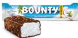
Bounty Ice Cream

Art.-Nr. MC5756.1 Inhalt 24 x 60 g pro Stück/Karton 1.80/43.20