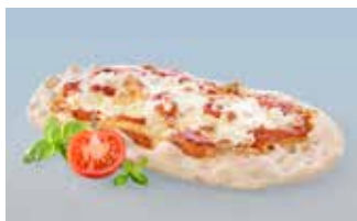
Pinsa ovale Margherita