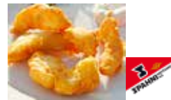
Zander-Knusperli im Bierteig

Art.-Nr. 17138 Inhalt 1 × 5 kg pro kg/Karton 18.80/94.00