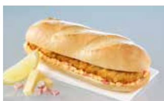
Schnitzelbrot Cordon bleu