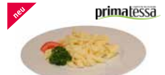
Eierspätzli lose gefroren

Art.-Nr. 1719.533 Inhalt 4 × 2,5 kg pro kg/Karton 6.30/63.00