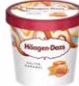
Häagen-Dazs Salted Caramel

Art.-Nr. MC5963 Inhalt 24 x 95 ml pro Stück/Karton 3.21/77.04