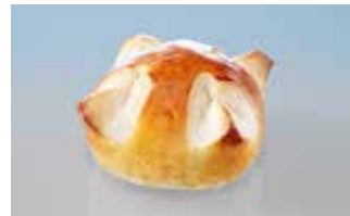
1. August-Weggen klein