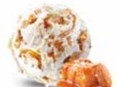
Almond Salted Caramel

Art.-Nr. 1002163 Inhalt 2000ml pro Bidon 20.90