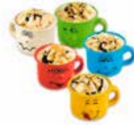
Tazzina di Pierino

Art.-Nr. MC5570 Inhalt 1500 ml pro Stück/Karton 16.27