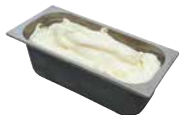
Mantecati Limone laktosefrei