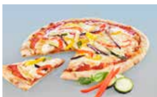
Pizza verdure 28 cm