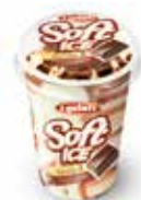
Soft Ice Vanille Schokolade