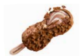
Ovomaltine Crunchy Ice