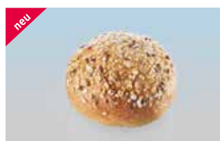
Grandissimo-Brötli 75 g