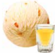
Eiercognac mit Orangenstreifen