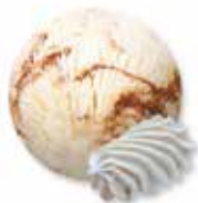
Doppelrahmglace mit Meringestückchen