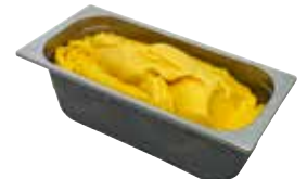
Mantecati Mango laktosefrei