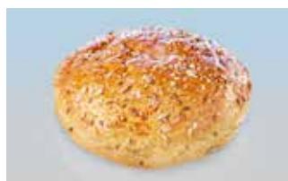
XL-Hamburgerbrötli 14 cm Rustica