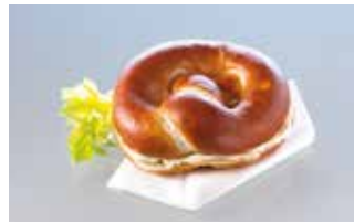
Laugenbrezel gefüllt mit Butter*