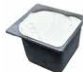
Mantecati Fior di Latte