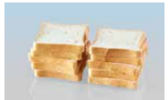
Toastbrot verpackt 250 g