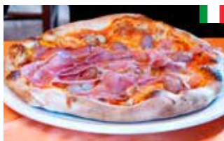
Pizza Prosciutto 28 cm