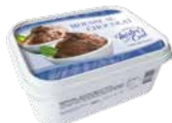
Mousse au Chocolat