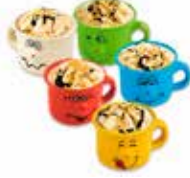
Tazzina di Pierino