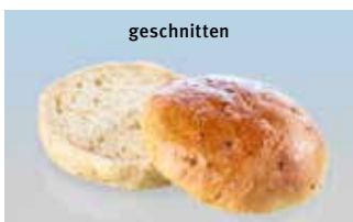
Hamburgerbrötli mit Röstzwiebeln