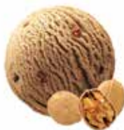
Baumnuss mit Nussstückchen