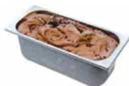
Mantecati Quore di Cacao