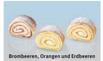
Brombeeren, Orangen und Erdbeeren