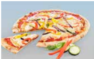
Pizza verdure 28 cm