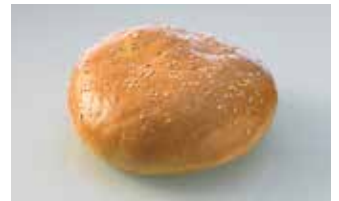
Hamburgerbrötli mit Sesam