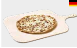
Flammkuchen Petit Elsässer Art