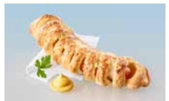
Wienerli im Teig