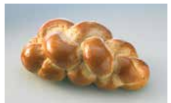
Gurtner Spez. Zopf 300 g