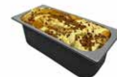
Mantecati variegato Mou/Toffee