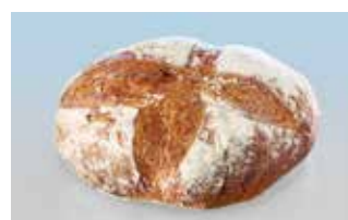
Altamura 2 Kg