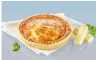
Käsechüechli 14 cm