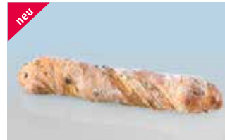
Schraubenbrot Oliven und Tomaten