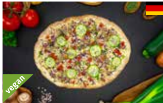
Flammkuchen Petit mit 7 Gemüsen