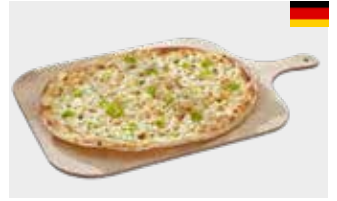
Flammkuchen Griechischer Art