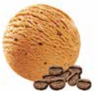
Eiskaffee mit Mokkastückchen