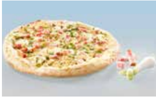
Flammkuchen Classic 28 cm