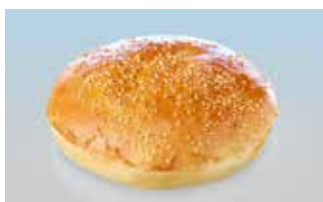
XL-Hamburgerbrötli 14 cm mit Sesam