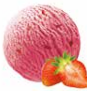
Erdbeere mit Erdbeerstückchen