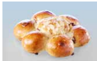
Königskuchen mit Schoggistückli