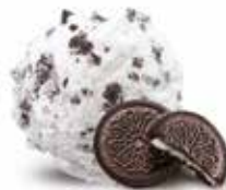
Cookies & Cream