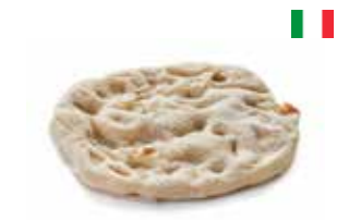
Pinsa Romana Mini 19 × 21 cm