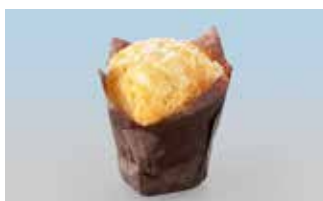
Weisser Schoggi Muffin