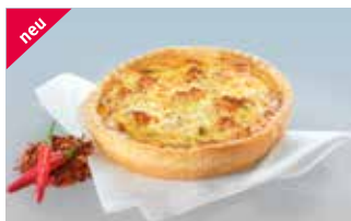
Chili-Gemüse-Fleisch-Chüechli 14 cm