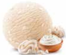
Crème De Gruyère