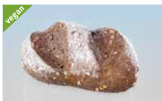
Schlossbrötli 70 g