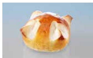
1. August-Weggen klein