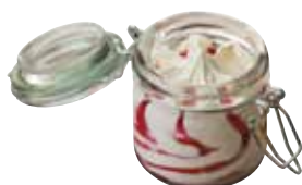
Confettura frutti di Bosco