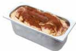
Mantecati Tiramisù Venezia