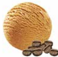
Eiskaffee ohne Stückchen