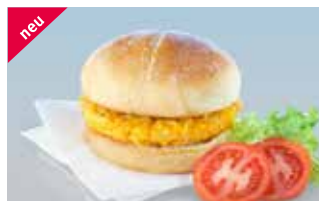
Crunchy-Poulet Burger Natur