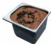
Mantecati Quore di Cacao