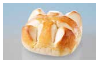
1. August-Weggen gross