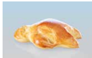
Mini-Grüttibänz 50 g