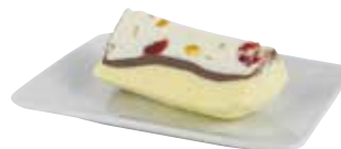
Cassata Schnitz (Rahmglace)