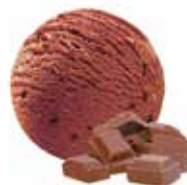
Schokolade mit Schokoladenstückchen