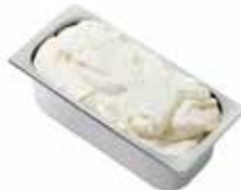
Mantecati Fior di Latte