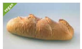
Ruchbrot 1 kg