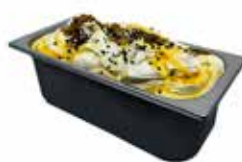
Mantecati Pina Colada