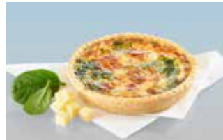
Spinat-Chüechli 14 cm