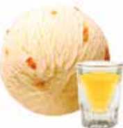
Eiercognac mit Orangenstreifen