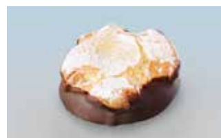
Amaretti mit Kirschbuttercrème