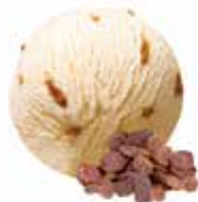
Jamaika mit Sultaninen