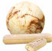
Tiramisu mit Biscuit