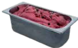
Mantecati Frutti di Bosco