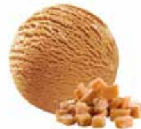
Caramel mit Rahmtäfelchen