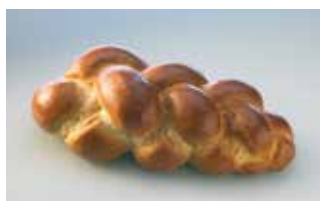
Gurtner Spez. Zopf 700 g