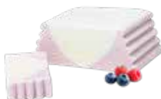
Glacestange Panna Cota