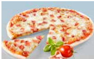
Pizza Prosciutto 28 cm