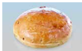
XL-Hamburgerbrötli 14 cm Speck