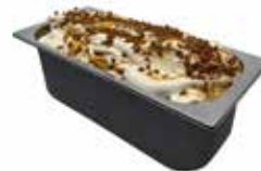
Mantecati Salted Caramel