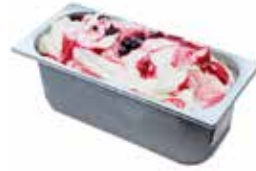
Mantecati Yogurt di Bosco