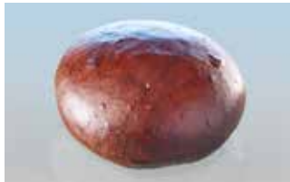
XL-Hamburgerbrötli 14 cm Laugen