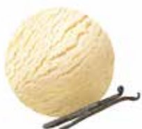
Vanille mit Vanillesamen