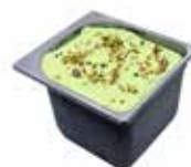
Mantecati Pistacchio Sicilia