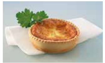
Käsechüechli 9 cm