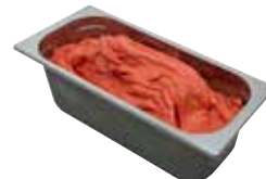
Mantecati Fragola laktosefrei