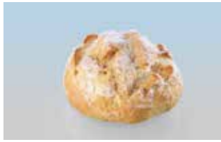
Bure-Brötli 75 g