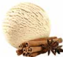
Zimt mit Caramelzucker