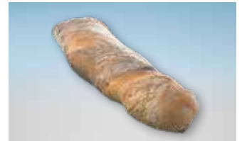
Pain Paillasse ruch