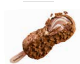
Ovomaltine Crunchy Ice