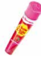
Chupa Chups Push Up