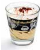
Latte Macchiato Mini