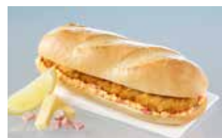
Schnitzelbrot Cordon bleu