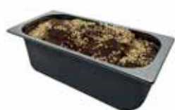
Mantecati Mec Rock/Rocher