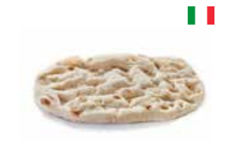
Pinsa Romana Classic 30 × 19 cm