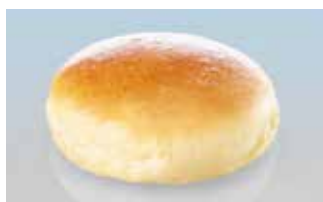
XL-Hamburgerbrötli 14 cm Brioche