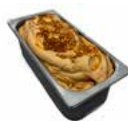
Mantecati Dulche de Leche