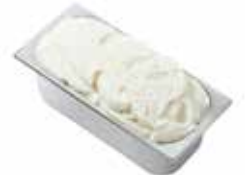
Mantecati Noce di Cocco