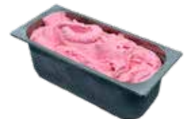
Mantecati Frutto della Lampone