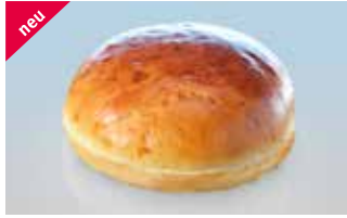
XL Hamburgerbrötli 14 cm ohne Sesam