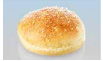
XL-Hamburgerbrötli 14 cm Mais