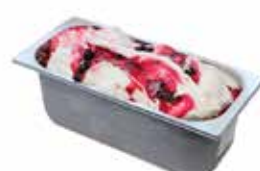
Mantecati Panna Amarena Fabri