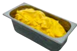
Mantecati Frutto della passione laktosefrei