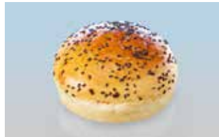
Hamburgerbrötli mit schwarzem Sesam