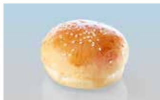
Hamburgerbrötli «kids» 7 cm