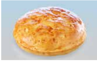
XL-Hamburgerbrötli 14 cm Knoblauch