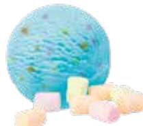
Puffo mit mini Marshmallows