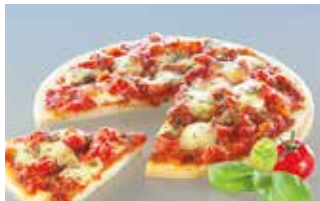
Pizza Margherita 28 cm