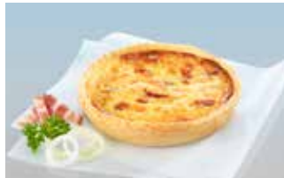
Quiche Lorraine 14 cm