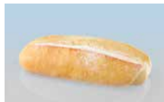
Ciabatta-Sandwich 18 cm