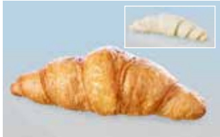
De Luxe Buttergipfel