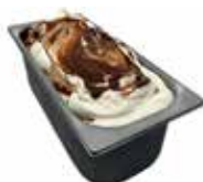
Mantecati Panna-Variegato con Nusella