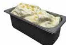
Mantecati Cioccolato Blanco/ weisse Schokolade