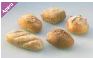
Party-Brötli Gemischt, 5 Sorten