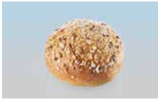
Grandissimo-Brötli 75 g