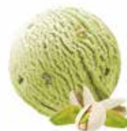
Pistache mit Pistazienkernen