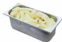
Mantecati Pistacchio Sicilia