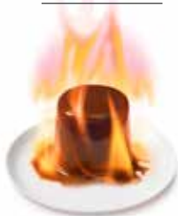
Parfait Mokka Gastro