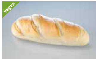
Halbweissbrot 1 kg