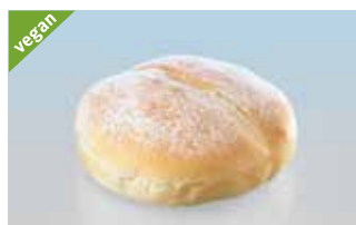
Ciabatta-Hamburger 14 cm