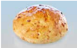
XL-Hamburgerbrötli 14 cm Röstzwiebeln