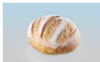
Maggia-Brötli 75 g