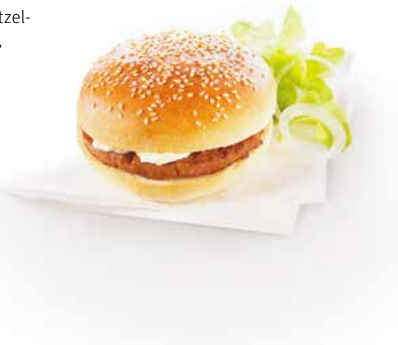
Hamburger mit CH-Rindfleisch

Wir bei Gurtner legen grössten Wert auf regionale Zutaten und die Herstellung in Bäckereien in der Nähe. Doch bei unseren Pizzen und Flammkuchen machen wir eine Ausnahme und überlassen die Backkunst teilweise unseren Nachbarn aus Deutschland und Italien. Verwöhnen Sie Ihre Kundschaft mit einer frisch gebackenen Pizza Margherita, Pizza Funghi oder Pizza Prosciutto e Funghi oder den beliebten Snack-Pizzas, die immer Platz finden. Die Flammkuchen mit Creme sowie Elsässer und Griechischer Art stammen aus Süddeutschland und ergänzen unser breites Angebot an salzigen Snacks perfekt.