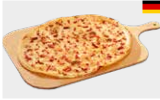
Flammkuchen Elsässer Art