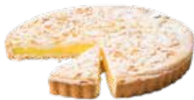
Torta della Nonna