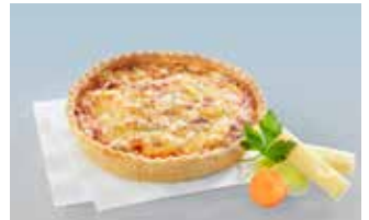
Gemüsechüechli 14 cm