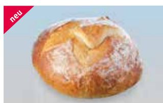
Altamura 400 g