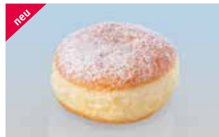
Berliner mit Schoggi