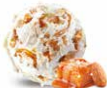
Almond Salted Caramel