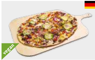
Flammkuchen mit 7 Gemüsen