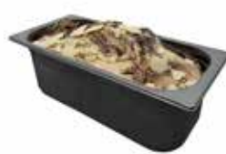
Mantecati Mammache Bueno