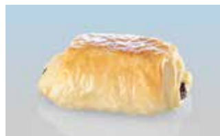
Pain au Chocolat