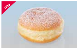
Berliner mit Aprikosenkonfitüre