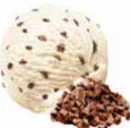
Stracciatella mit Schokoladensplittern