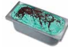
Mantecati Ciocomenta Fabbri