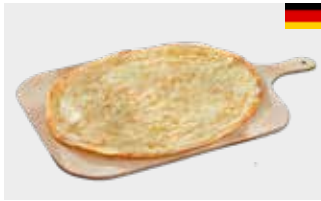
Flammkuchen mit Crème