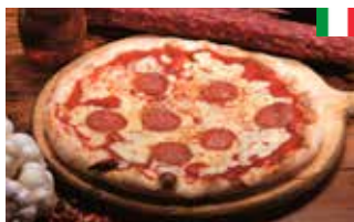
Pizza Chorizo 28 cm