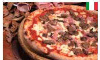
Pizza Prosciutto et funghi 28 cm